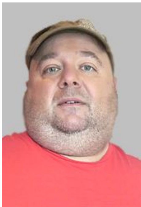
Dirk Bach, Germana aktoro e bufono

di London balde on freque audis: "Stop, show your identity card, please!" ... Kurta pauzo ... BLAMM!