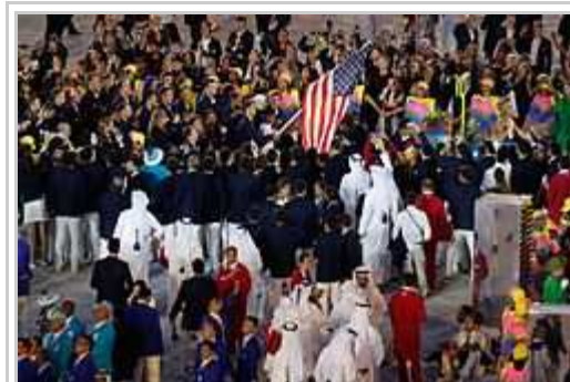
Usana delegaciono dum l'inauguro-ceremonio.