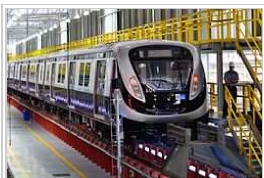
Treno di la "Lineo 4", la 3ma lineo dil urbala fervoyo di Rio de Janeiro.

Komence ricevita entuziasmoze dal populo, la selekto di Rio de Janeiro por gastigar la Ludi gradope komencis recevar forta kritiki de multa Braziliani, sive pro la granda expensi bezonata por plubonigar la substrukturo dil urbo, sive pro desfidi pri mizuso di publika kolokajo por finar la labori justatempe, sive pro perdo di fido pri la politikistaro. En kelka loki eventis protesti dum la transporto di l'olimpiala flamo, e kelkafoye on probis extingar la flamo.