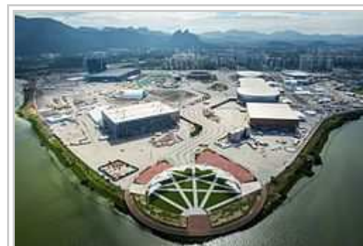
Aerala imajo pri l'Olimpiala Parko en la quartero Barra da Tijuca.