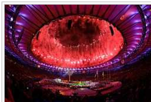
Pirotekno dum la klozo-ceremonio.