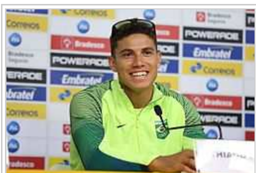
Thiago Braz da Silva.

Pri stango-salto por viri, Braziliana Thiago Braz da Silva ganis l'ora medalio pos saltar 6.03 metri, e ruptis l'Olimpiala rekordo por ica sporto-speco.