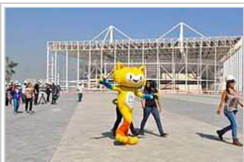
Vinicius , un ek la talismani di la Ludi.

L'Olimpiala Ludi en Rio de Janeiro, 2016 , od oficale la 31ma Olimpiala Ludi , esas internaciona plursporta konkurso qua eventis en 2016 en Rio de Janeiro, Brazilia. Lore unesmafoye Sud-Amerikana lando