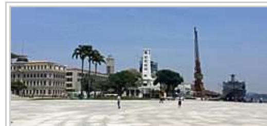
Placo Praça Mauá , 2015.