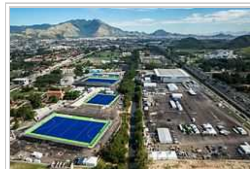
La konstrukto di ludeyi en Deodoro.