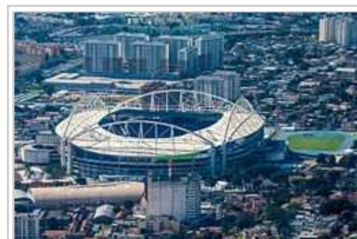
Stadio Engenhão .

La maxim multa konkursi pri atletismo eventis en la stadio João Havelange , anke konocota kom Engenhão , en la quartero Engenho de Dentro, en la norda parto dil urbo. La stadio João Havelange inauguresis en 2007 por la Tot-Amerika Ludi ed