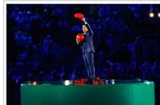
Chefministro di Japonia Shinzo Abe arivas en la stadio, vestizita quale Mario .