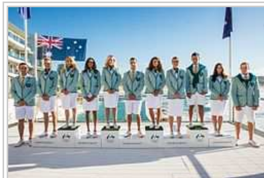
Uniformo di l'Australiana delegitaro.