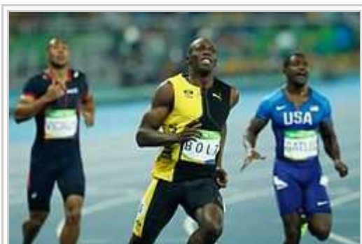
Dedextre adsinistre: Justin Gatlin, Usain Bolt e Andre De Grasse

Usain Bolt de Jamaika ganis lua triesma ora medali pri 100-metra kurado por viri. Usana Justin Gatlin