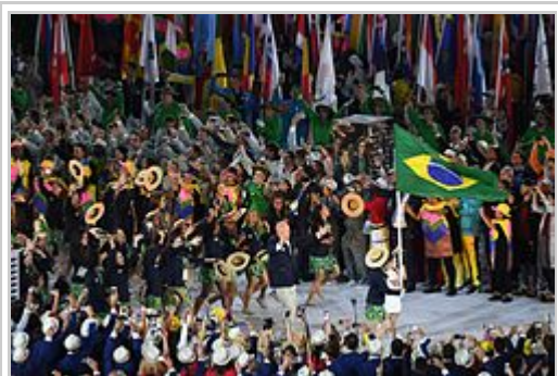
Brazilian atleti eniras la stadio Maracanã.

Mauricio Macri, Lituaniana Dalia Grybauskaitė, Nederlandana rejulo Willem-Alexander e la chefministro Mark Rutte, e la chefministro Italiana Matteo Renzi. [14]