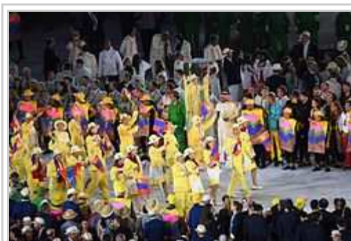
La delegaciono di Mongolia dum l'inauguro-ceremonio.