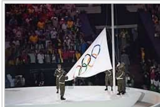
Hiso dil Olimpiala Standardo dum l'inauguro-ceremonio.