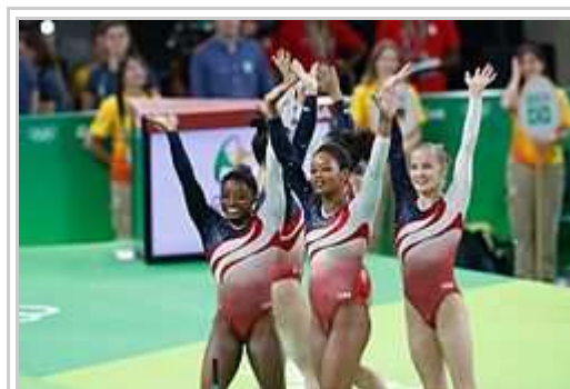
Usana esquado pri Olimpiala gimnastiko por mulieri. Sinistre, Simone Biles.