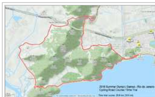
Treko por la biciklo-konkurso kontre-horloja.