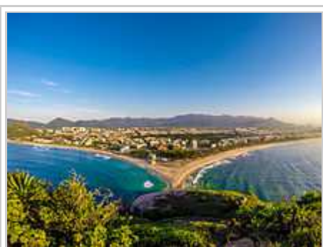
La peninsuleto Pontal, loko por la starto dil konkursi pri atletala marcho.

La maxim multa konkursi pri atletismo eventis en la stadio João Havelange , anke konocota kom Engenhão , en la quartero Engenho de Dentro, en la norda parto dil urbo. La stadio João Havelange inauguresis en 2007 por la Tot-Amerika Ludi ed