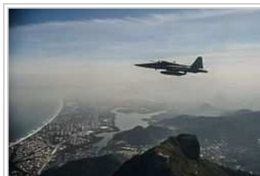
Aviono F-5EM de Brazilian Aer-Armeo dum entreno pri intercepto e defenso ante l'inauguro di la Ludi.