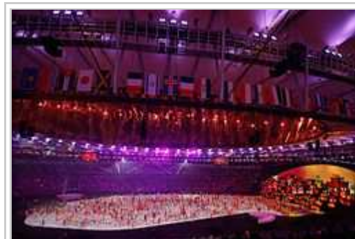
Inauguro-ceremonio dil Olimpiala Ludi en Rio de Janeiro.

Cirkume 78.000 personi esis en stadio Maracanã por l'inauguro-ceremonio. [12] Unesmafoye esquadro kompozita nur per refujant atleti - entote 10 personi - konkursis en la Ludi, sub l'Olimpiala Flago. [13] Inter la