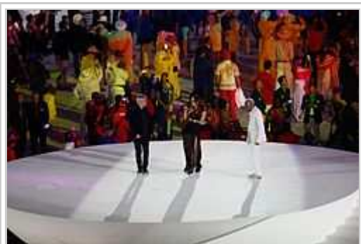
Desinistre addextre, la kantisti Caetano Veloso, Anitta e Gilberto Gil.

Cirkume 78.000 personi esis en stadio Maracanã por l'inauguro-ceremonio. [12] Unesmafoye esquadro kompozita nur per refujant atleti - entote 10 personi - konkursis en la Ludi, sub l'Olimpiala Flago. [13] Inter la