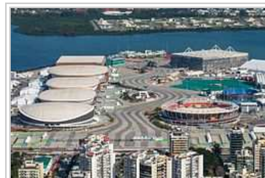
L'Olimpiala parko en la quartero Barra da Tijuca .