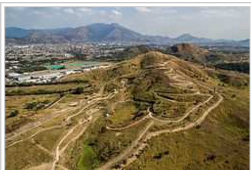
La centro pri montala biciklismo, en Deodoro.

La konkursi pri biciklismo en Rio de Janeiro eventis en 4 loki: L'Olimpiala treko por BMX-konkursi konstruktita en la quartero Deodoro, la centro por montala biciklismo anke en Deodoro, la velodromo en