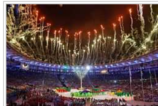
Klozo-ceremonio en Maracanã, Rio de Janeiro.