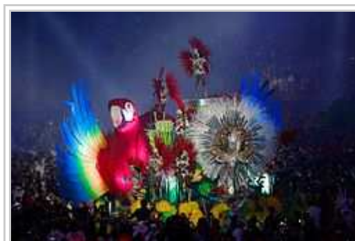
"Karnavalo" dum la klozo-ceremonio.