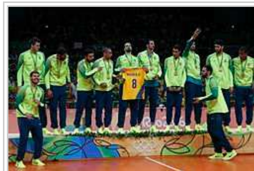
Brazilian esquadro pri volebalo, pos recevar l'ora medalio.

Yen la listo di landi qui recevis adminime 1 bronza medalio en Rio de Janeiro en 2016. Entote, 87 landi o esquadi ganis adminime 1 bronza medalio. [90]