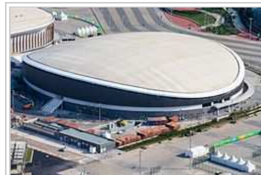
Velodromo di Barra da Tijuca.

La konkursi pri biciklismo en Rio de Janeiro eventis en 4 loki: L'Olimpiala treko por BMX-konkursi konstruktita en la quartero Deodoro, la centro por montala biciklismo anke en Deodoro, la velodromo en