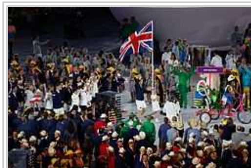
Andy Murray portas la Britaniana standardo dum l'inauguro-ceremonio.