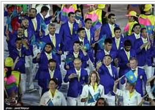
Atleti de Kazakistan paradas dum l'inauguro-ceremonio.