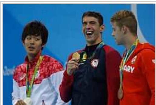
La premiiziti Michael Phelps (ora), Japoniana Masato Sakai (arjenta) e Hungara Tamás Kenderesi (bronza) por la 200-metra natado papiliono-stila.

La 4ma medalio ganita da Michael Phelps en Rio de Janeiro esis arjenta, por 100-metra natado papiliono-stila [22] kun altra du atleti: Chad le Clos e László Cseh. [22] En la sama konkurso, Joseph Schooling de Singapuro ganis la ora. [22] Phelps ganis ora anke por la 200-metra natado libera-stila, e por la 4x100-metra natado libera-stila.